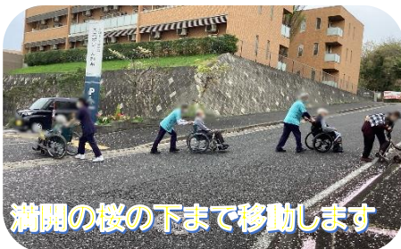
満開の桜の下まで移動します

こちらはデイケアの皆さまのお花見の様子。今年は雨の日も多く、一部のご利用者さまのお花見は かないませんでした。この季節ならではの風景を楽しんでいただきました。